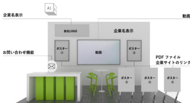
出展ブースイメージ

気になる技術・製品がありましたら、問い合わせ機能を使って 出展者へ商談依頼等のメッセージを送ることが可能 です。 ぜひご活用ください。